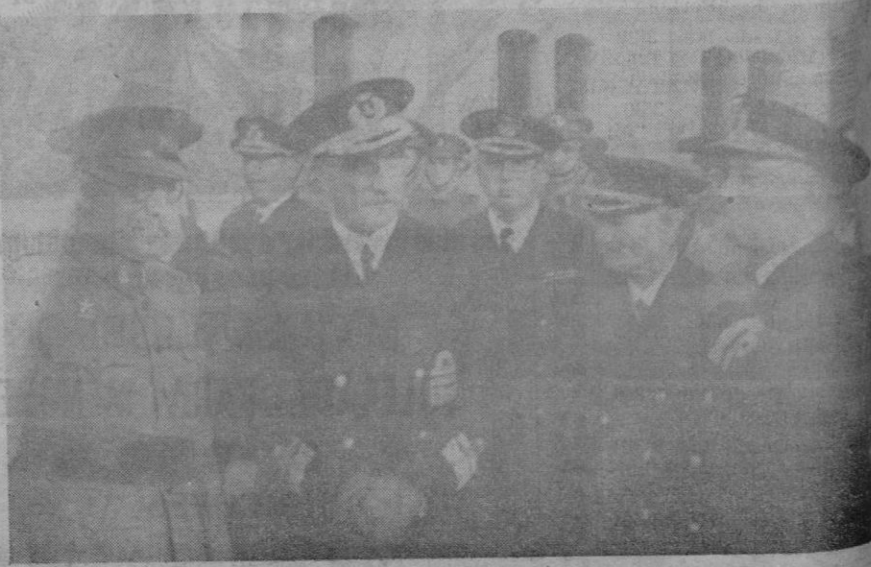
El Almirante Moreno con el general Cánovas, Almirante Bastarreche y Vicealmirante Oramiz el día de su llegada a nuestra ciudad