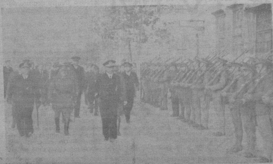
El Almirante Moreno a su entrada en Palma, recibiendo una sección de tropas que le rindió los primeros honores