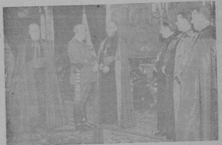
S. E. el Generalísimo recibe el juramento del Arzobispo de Burgos y de los Obispos de Segovia, Segorbe, Orense y Orihuela que fueron recientemente nombrados.