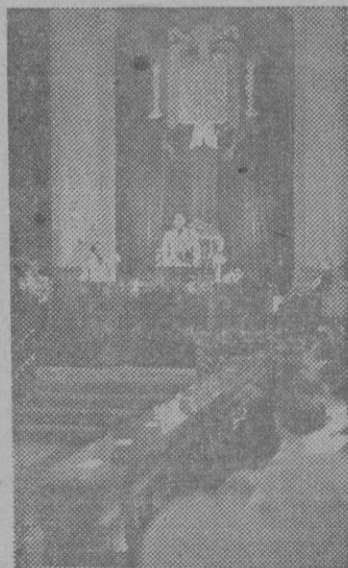
El Ministro Secretario General del Movimiento pronuncia su interesante discurso en la sesión inaugural del III Consejo Sindical Industrial