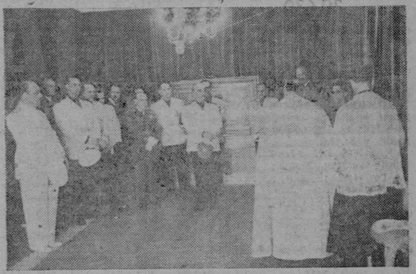
Madrid. -- El Generalísimo Franco, con el Ministro Secretario General, camarada Arrese, inaugura la Emisora de Arganda instalada por la Vicesecretaría de Educación Popular.