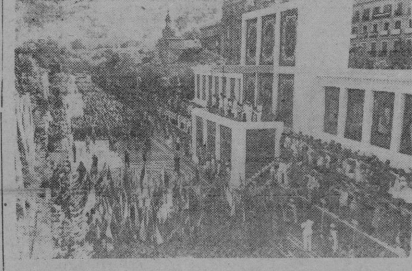
Madrid. -- Un grupo de productores desfilando ante el Caudillo, con motivo de la festividad del 18 de Julio.