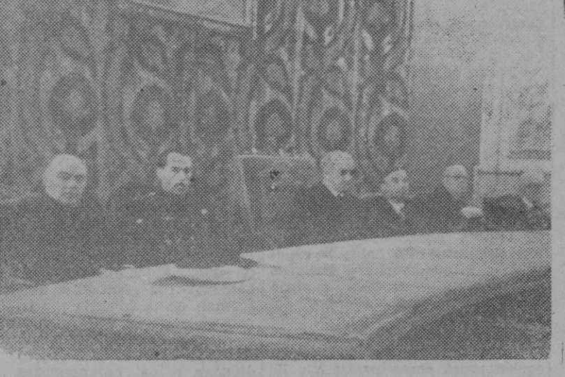
En la Universidad de Madrid se ha inaugurado el curso de la Facultad de Ciencias Económicas y Políticas.