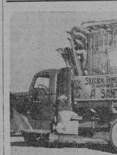
Teruel. — Bajo la consigna "Campana contra el frío" la Sección Femenina de Teruel ha repartido ropas y enseres entre la población necesitada de la provincia, por importe de un millón de pesetas. La Jefatura Provincial del Movimiento ha recogido en una memoria esta labor realizada con verdadera abnegación. La fotografía representa uno de los doce camiones enviados a la comarcal de Santa Eulalia

Tirana. — Cerca de Shpiska, el Sur de Albania, se ha descubierto una fosa con 170 cadáveres de campesinos de las comarcas de Kortska, Berat y Valona deportados y asesinados por los comunistas.