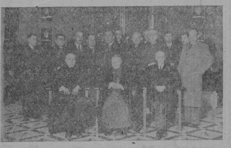
El nuevo Consejo Diocesano de los Hombres de Acción Católica, reunido en torno de nuestro Prelado durante la víspera que le hizo el pasado domingo en el Palacio Episcopal.