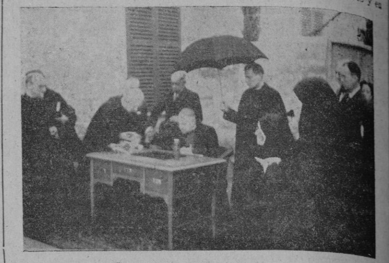
El Excmo. y Rldmo. Sr. Arzobispo Obispo de Mallorca en el momento de firmar el acta

En la residencia que las Religiosas Oblatas del Santísimo Redentor poseen en el caserío de La Vileta, celebró el pasado domingo solemnisísima fiesta con motivo de la bendición y colocación de la primera piedra del nuevo templo que, adosado a dicha residencia — mejor integrante de la misma — va a ser construido.