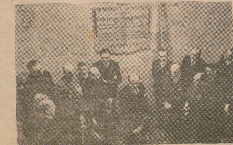
Acto de descubrimiento de la lápida conmemorativa de los funcionarios de las Cortes, caídos.

Asimismo se insertan los nuevos proyectos llegados a las Cortes últimamente, que son los que conseguimos a continuación.