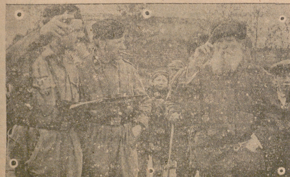
En un pueblo recién conquistado, la población de éste se presta para guiar a los soldados del Reich, donde se guarecen los bolcheviques.

Actuó de padrino el director general de Enseñanza Media, en representación del excelentísimo señor ministro de Educación Nacional, asistiendo a la ceremonia varios excelentísimos señores prelados y numerosísimo público.—CIFRA.