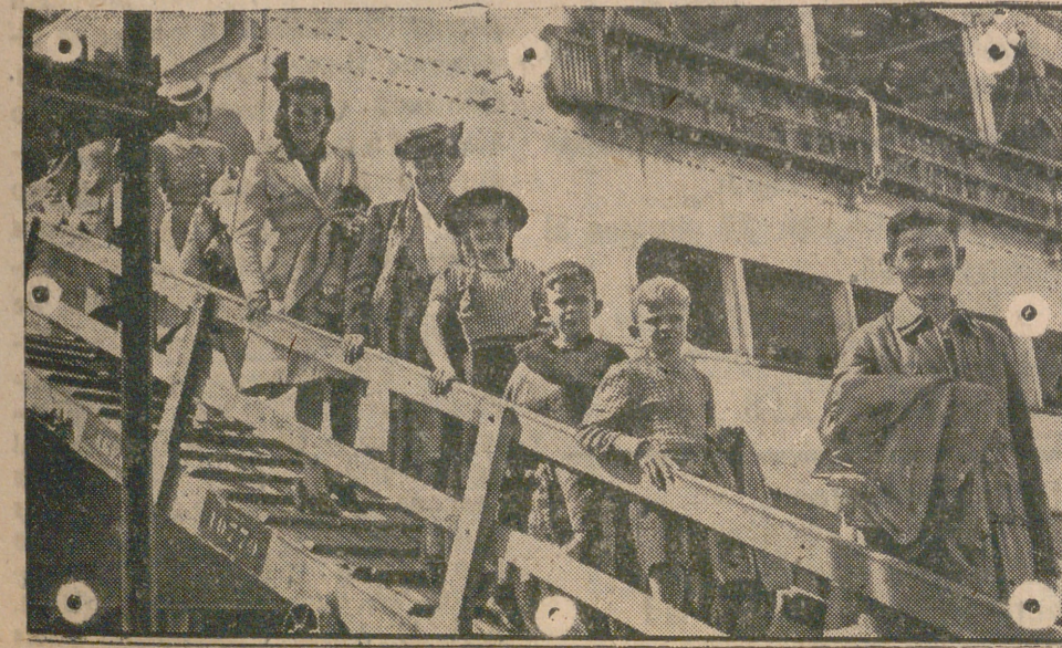
Una foto de la legada a Lisboa, en el vapor español «Marqués de Comillas», de 104 súbditos alemanes que de Guatemala, Honduras y Costa Rica regresan a su Patria vía Portugal y España.