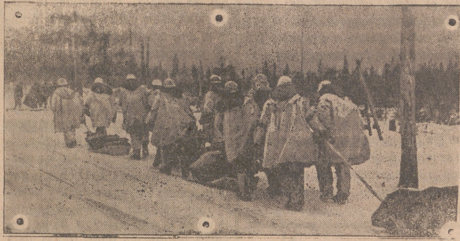
Un grupo de soldados alemanes se dirige a una posición de vanguardia. Para el transporte del equipo y municiones utilizan los famosos trineos «Akjas».