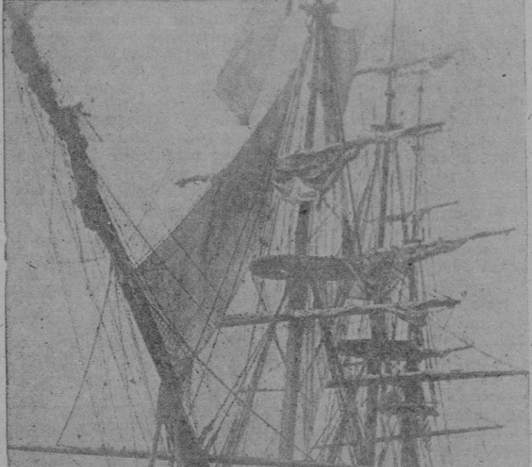
Una veterana de los mares: la fragata de líneas elegantes, con su airoso y complicado aparejo.

En la navegación civil se han construido palacios tan suntuosos como el "Titanic", de infausta memoria; el "Bremen", que