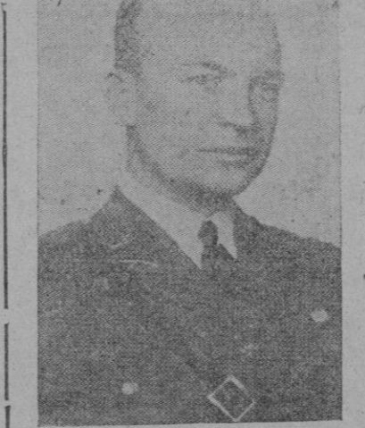
El general Eisenhower, Comandante en jefe de las tropas norteamericanas desembarcadas en el Norte de África

Berlín. — En Stalingrado las tropas de asalto alemanas abrieron ayer nuevas brechas en las posiciones bolcheviques y rechazaron a los soviets en una extensión de 200 metros, según reconoce la emisora moscovita. Como quiera que hace algunos días las radios británica y rusa decían que en el sector del Volga aun defendida por los soviéticos solo tenía una profundidad de 600 metros, resulta que aquellos han perdido una tercera parte de las posiciones que aun le quedaban. Berlín. — Los bolcheviques atacaron ayer con fuerzas importantes las posiciones de montaña alemanas del oeste del Cáucaso, comunicó la Oficina Internacional de Información. Los ataques fueron apoyados por varias escuadrillas de bombardeo. Los bolcheviques lograron penetrar en las líneas alemanas, sobre todo en un lugar los soldados rusos lograron cercar un grupo de cazadores de montaña alemanos. Entre estos últimos se encontraban