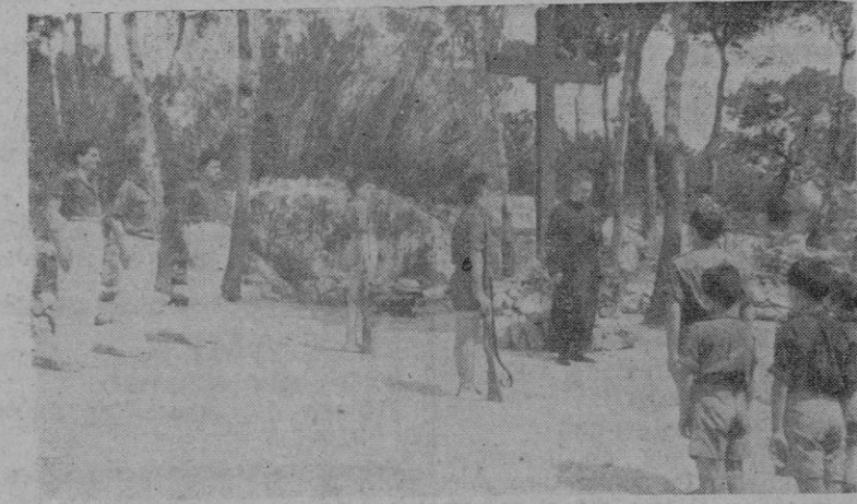
Todos los días, ante la Cruz de los Caídos se eleva en los Campamentos del Frente de Juventudes una oración por los que dieron la vida por Dios y por la Patria