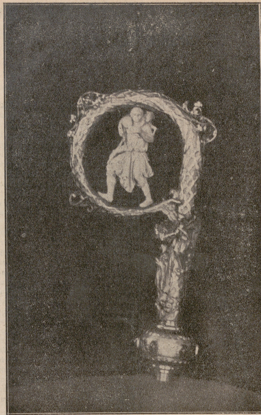
Báculo donado al nuevo Prelado por el Excelentísimo Cabildo y clero diocesano.

¡Bendito el que viene en nombre del Señor!