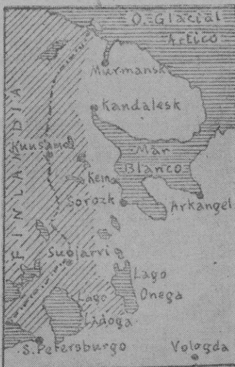
La región norte del frente del Este, en cuya parte superior se encuentran la ciudad y el puerto de Murmansk, duramente bombardeados ayer por la aviación germana

Los cazas alemanes que escoltaban a los «stukas» que tomaron parte en la opera-