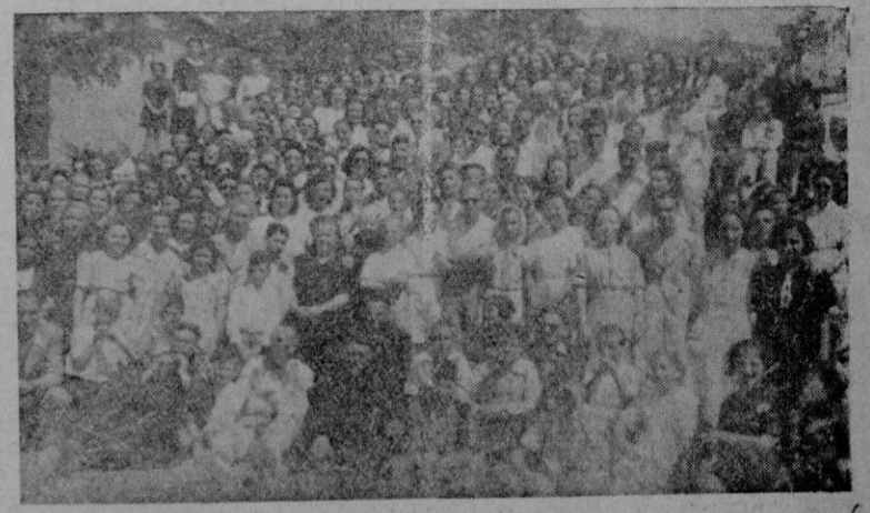
Uno de los grupos de peregrinos asistentes a la misma