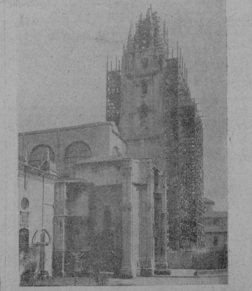
Disposición del andamiaje que se ha levantado para la reconstrucción de la torre de la Catedral de Oviedo

Parece que la fatalidad se ha ensañado en ella, pues en 1575 y en 1723 la arruinaron dos rayos El trabajo de reconstrucción que a causa de los destrozos causados por los bombardeos de los rojos se ha comenzado ahora, brinda una concienzuda labor técnica