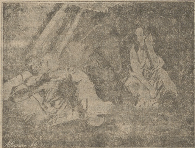
GRABADO 3.—¿TIENEN QUE COMER?

Perdonadme. Pero todavía tenemos que adentrarnos más en este infierno, antes de mostraros—o haré a no tardar—el esfuerzo de la caridad católica. Mirad esos montones de cadáveres, que se ofrecían con bastante frecuencia a la vista del viajero en Rusia meridional durante los años 1921 y 1922. No son haces de leña o rimeros de ramas secas; sino cuerpos humanos, de niños sobre todo. La lupa permite contar ¡hasta treinta y cinco cadáveres de niños! Pero lo más terrible