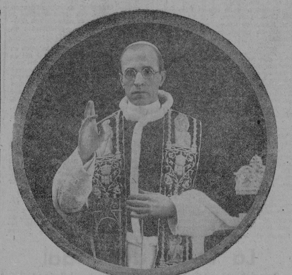
Oremos por nuestro Pontífice Pío XII