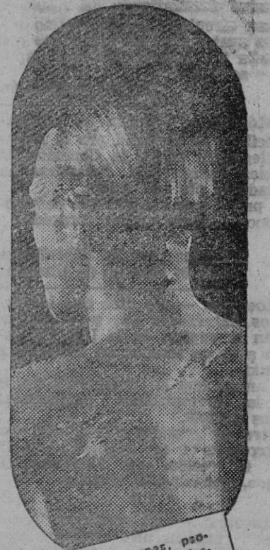
El eczema, herpes, psoriasis, etc., son manifestaciones de una sangre viciada que se debe purificar con el DEPURATIVO RICHELET

ser de nuevo el líquido que alimenta y lleva la vida a todas las células del organismo.