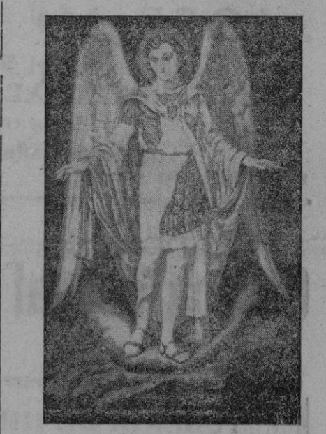
El Santo Angel de la Guarda, Patrón de la Policía Gubernativa. Cuadro que hoy ha sido bendecido y que ha pintado el notable pintor don Pedro Barceló

(Continúa al final de la primera columna de la segunda página)