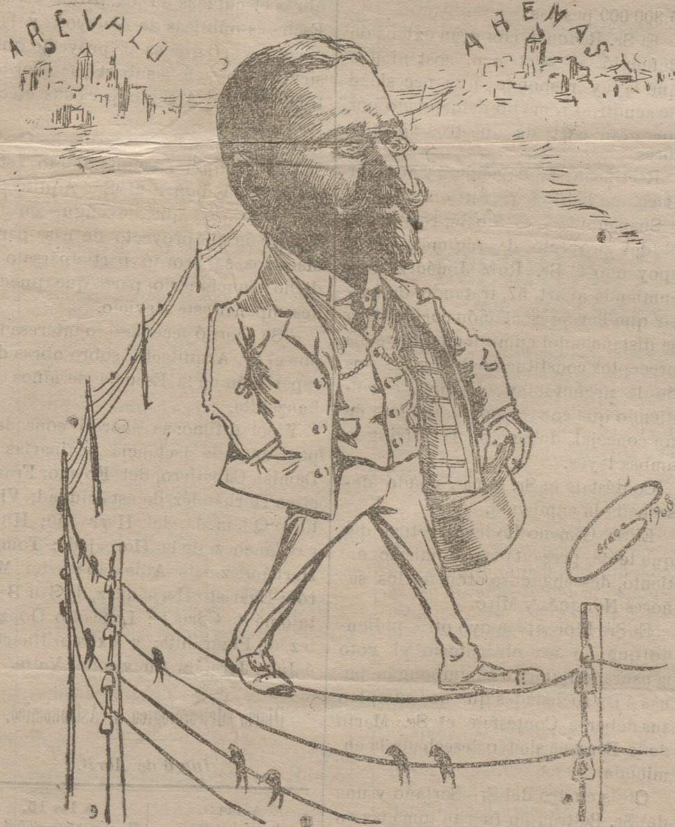
Nota del dibujante.