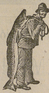
Obténase siempre la Emulsión con esta marca "El Pescador," marca del procedimiento Scott!

ninguna otra emulsión, más que la de SCOTT, podía haber salvado á este niño, porque ninguna otra emulsión se compone de los mismos materiales puros y energicos, ni gustan tanto al paladar del niño, ni se digieren con la misma facilidad por el estómago del nene. La de SCOTT conviene usar la emulsión que está probado que cura—la de SCOTT con el Pescador y el Pescado en cada paquete. La de SCOTT no es un experimento. Es la certeza. Ninguna otra emulsión disfruta tan altas recomendaciones como la de SCOTT. En todas las droguerías y farmacias. Por 75 cts. en sellos para franqueo, D. Carlos Marés, Calle de Valencia, 333 Barcelona, enviará una muestra gratis que le demostrará que á su niño le gusta la Emulsión Scott y la digiere.