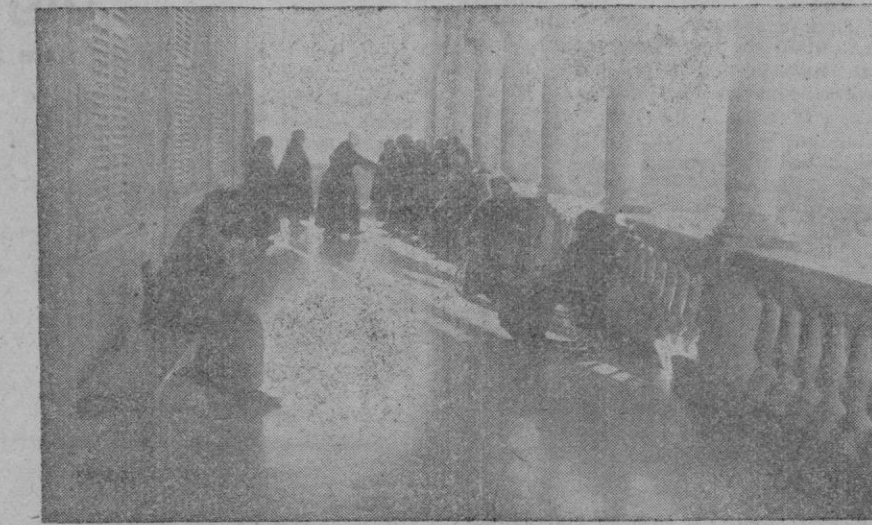
Bajo el cuidado solícito de las buenas Hermanitas, las ancianas, sentadas al sol, disfrutan la bondad del tiempo otoñal

y la fuerza de voluntad. Seis hermanitas formaban la primera comunidad. Abrióse el Asilo. Y al día siguiente recibían a la primera anciana; a los dos días tenían ya seis; y el 22 de enero, eran admitidos los dos primeros hombres. Al mes justo de la fundación, la casa contaba con 29 asilados.