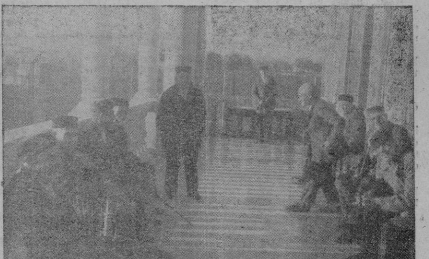
Y los ancianos tienen también, en su departamento, la tertulia, amable y familiar, al aire libre

Muchos de ellos tuvieron un oficio que, con pueril vanidad, continúan ejerciendo. Pero les falta la fuerza a muchos y a otros les tiemblan las manos: para casi todos llegó ya la vejez, con su séquito de achaques y sufrimientos.