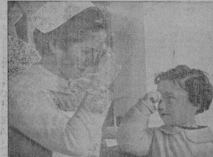
El gesto hosco del niño a quien enseñaron a odiar, es convertido por "Auxilio Social" — por el cariño y el entusiasmo de sus mujeres abnegadas — en además de amor y de paz