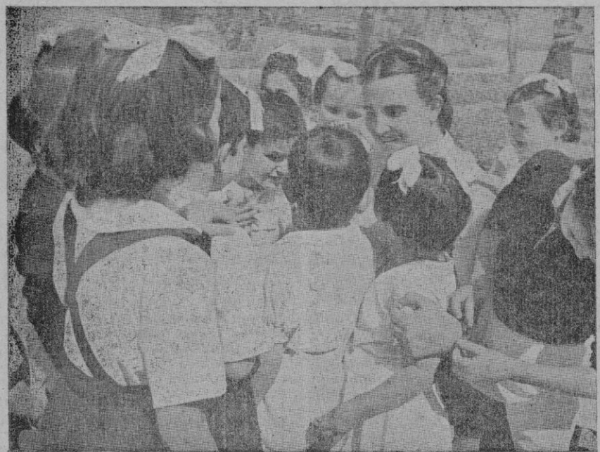
Entre la alegría y el bullicio de un hogar infantil — hace pocas semanas inaugurado — Mercedes Sanz Bachiller, Delegada Nacional de "Auxilio Social", habla y pasa un rato con los pequeñuelos.

Qué fué y es — ante todo y sobretodo — por una Patria más justa y mejor. Por el Pan y la Justicia.