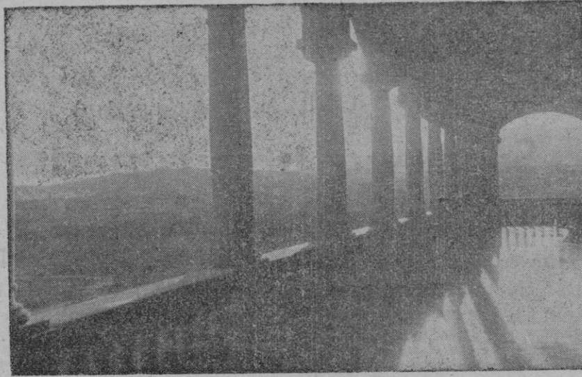
Esta foto — obtenida anteaer — es una bella muestra del panorama que se divisa desde las galerías del Asilo, magníficamente emplazado, lleno de luz y de sol.

Dos horas con las Hermanitas y sus ancianos: inolvidable impresión de paz, de orden, de sosiego