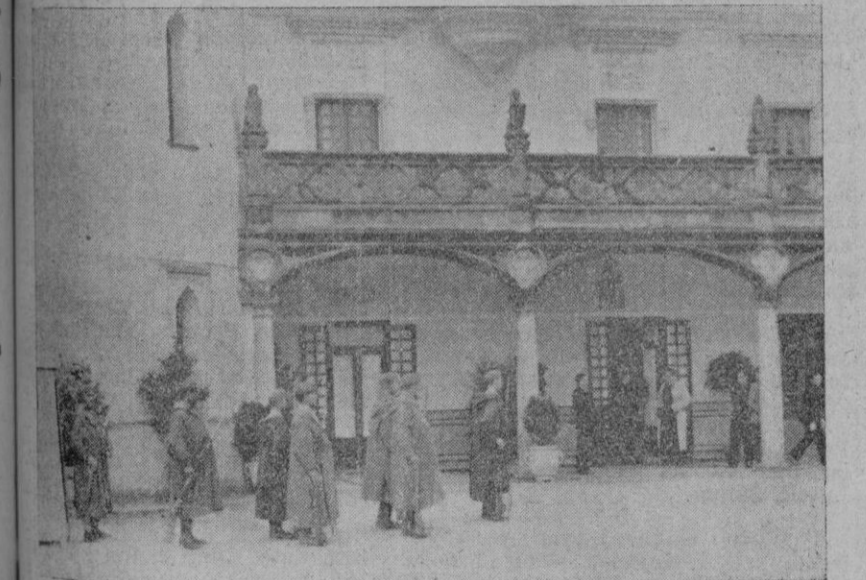
La hora del relevo de la guardia interior en el castillo de Viñuelas.

Viñuelas: Castillo y caserío de la provincia de Madrid, municipio de El Pardo. Es una de las posesiones que dependieron del Real Sitio de El Pardo y en ella solía cazar Carlos III. Posteriormente pasó a manos del marqués de Campo y luego del conde de Santillana.