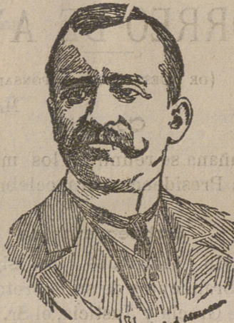
El Conde de Romanones, Ministro de Gracia y Justicia.