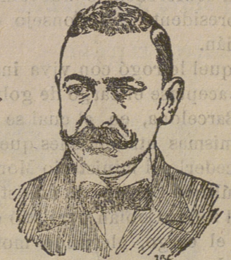
Don Manuel García Prieto, Ministro de Fomento.