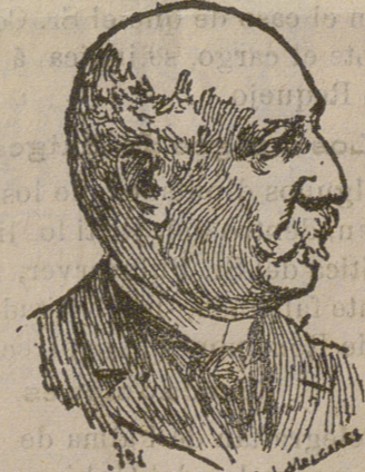
Don Pío Gullón, Ministro de Estado.