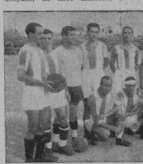
El "once" del "Baleares", que se enfrentó ayer tarde al del "Mallorca".

En Felanitx, ante mucha concurrencia, jugóse ayer tarde el anunciado partido "Gimnástica" - "Constancia". Los equipos, a las órdenes del colegiado Sr. Bonet, asesorado por los Sres. Font y Fuentes, firmaron así: "Constancia": Company; Vera,