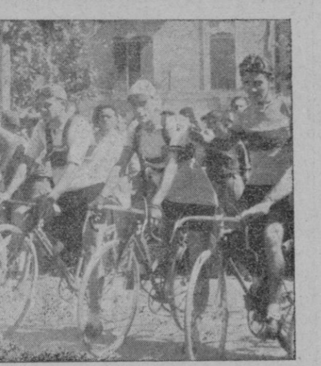
Los corredores que han tomado parte en la "V Vuelta Ciclista a Mallorca".

Ayer tuvieron lugar, las tercera y cuarta etapas de la "Vuelta a Mallorca", dándose la salida de Artá a las 7 h. 19 m. de la mañana, tomando parte siete corredores. El recorrido de Artá-Campos se hizo con muy pocas ganas, sin duda para reservarse para la dura etapa que les esperaba por la tarde. Desde la entrada a Campos hasta el Velódromo, un gentiazo inmenso cubría toda la carrera por donde debían pasar los corredores, que a medida que se acercaban forzaban el tren para corresponder al entusiasmo con que les había recibido el pueblo, haciendo una entrada formidable.