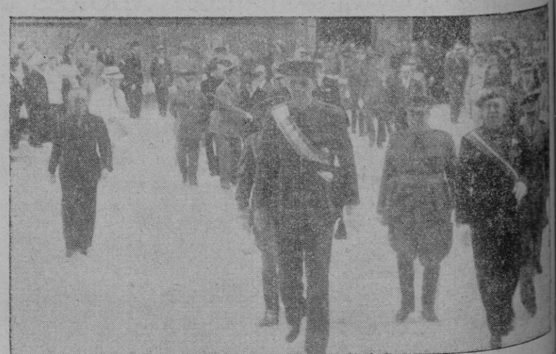
El Comandante General y el Gobernador al salir de la Catedral terminada la solemne función religiosa.