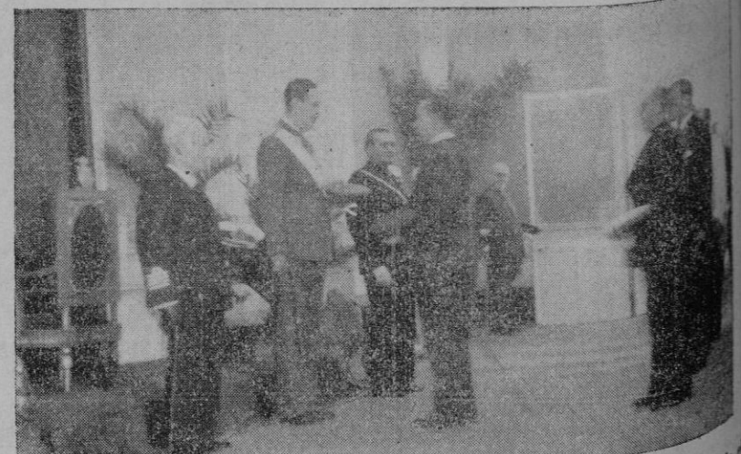
Durante la recepción, en los salones de la Comandancia General, el general Kindelán es saludado por el Alcalde de Palma, a la cabeza del Ayuntamiento.