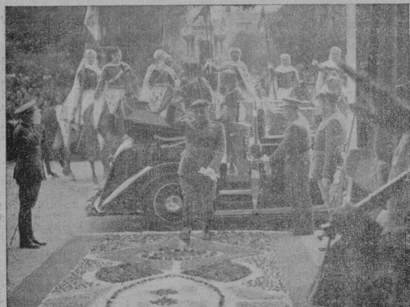
Valladolid. — El Caudillo a su llegada al Ayuntamiento vallisoletano, donde almorzó con los Fiscales Delegados de la Vivienda y donde le fueron entregadas las insignias de Alcalde honorario de Valladolid.