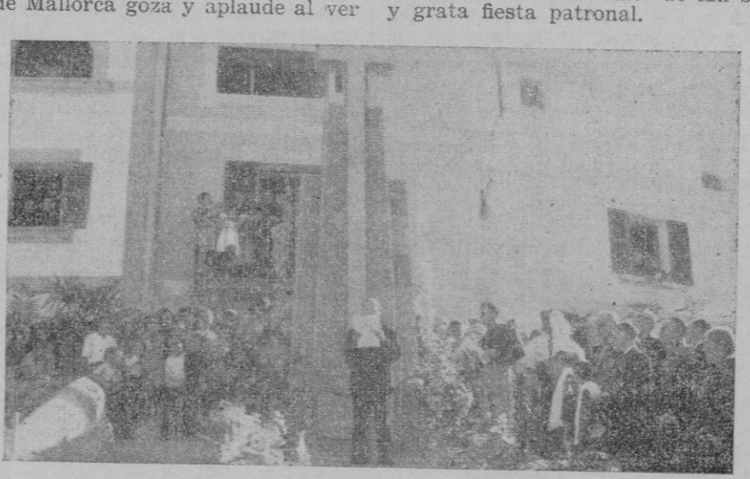
El acto de la inauguración de la Cruz de los Caídos.

De acuerdo con el programa trazado, el pueblo de Buñola acaba de reanudar su añeja tradición de fiestas patronales, interrumpida, excepto en lo religioso, durante los años de la guerra, durante los años de la guerra, durante los años de la guerra, durante los años de la guerra, durante los años de la guerra.