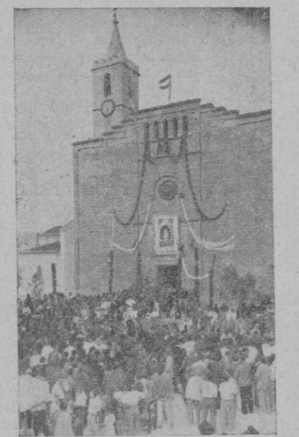
Un aspecto de la salida de la procesión de la Virgen Trobada de San Lorenzo

Terminada la misa solemne comienza la oración por España y por cada uno de los gloriosos Caídos del pue-