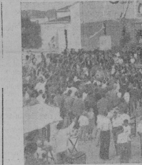
La peregrinación de Son Carrió saliendo del templo para acompañar la Virgen Trobada de San Lorenzo

La consagración a la Virgen Trobada de los ex-combatientes San Lorenzo ha sido uno de los pueblos de Mallorca que en relación a su número de habitantes ha dado más combatientes a la España Imperial. La mayoría de los destacados en Mallorca y algunos de la Península se hallan presentes en estas fiestas por ellos y para ellos organizadas. "A nuestra Morenita que no se le olvida así como así", en frase de uno de ellos, quieren todos ofrecer sus personas. Para Ella habían sido las primeras visitas de su regreso; La habían llevado consigo siempre durante la Cruzada; la habían recordado centenares de veces en sus cartas del frente: "Todos llevamos, dice una, dentro del bolsillo a nuestra Virgen Trobada y la agradecemos haya estado siempre a nuestro lado". "Por mucho que retumben los cañones, decía otra, por las lomas y montículos nunca nos olvidamos de pensar y rogar a nuestra Virgen". "Siempre estoy pensando en Ella y con Dios", añadía un tercero. "Cuando terminamos de rezar el rosario, acto de cada noche, pedí para rezar todos una Salve a nuestra Madre la Virgen Trobada y fué una idea muy aplaudida por los demás comba-