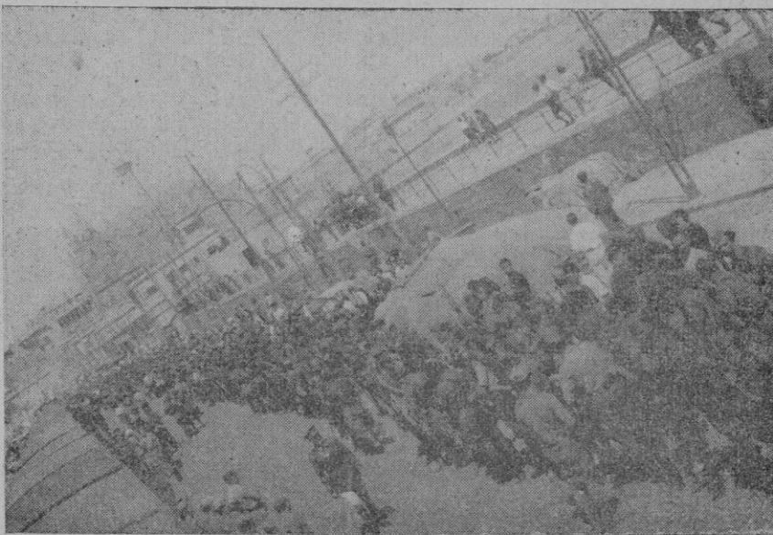
Las tropas expedicionarias de infantería llegadas ayer de la Península, formadas en el muelle para reintegrarse a sus cuarteles