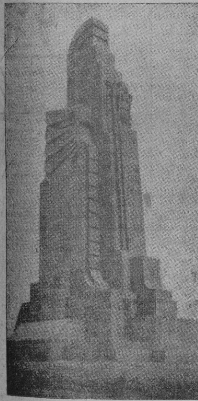
El monumento de piedra señala el lugar de la concentración en el Llano Amarillo de Ketama...

Cuando nadie esperaba que en agosto de 1936 se practicara manobras militares en África, el mando supremo lo dispuso de una manera precisa y casi imprevista. Pero el ejército de África, a pesar del mal que padecía entonces, porque había compenetración satisfactoria ni armonía posible entre los sucesos inmediatos, se lanzó con alegría a los fatigosos ejercicios de sus armas, y los cumplió con el mismo entusiasmo de sus buenos tiempos. No creía, en verdad, al verle realizar en tal presteza y aptitud los objetivos tácticos del plan desarrollado en brillantemente, que era aquélla la fuerza mediata y esclavizada por los siniestros cabecillas de la revolución extranjera. Fueron esta vez campo, a las montañas de su victoria, como siempre, mejor que siem-