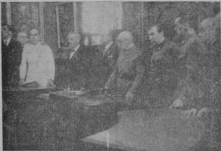
La presidencia del acto celebrado ayer en las Casas Consistoriales con motivo de imponer a los aviadores españoles la medalla de la Aviación de Mallorca