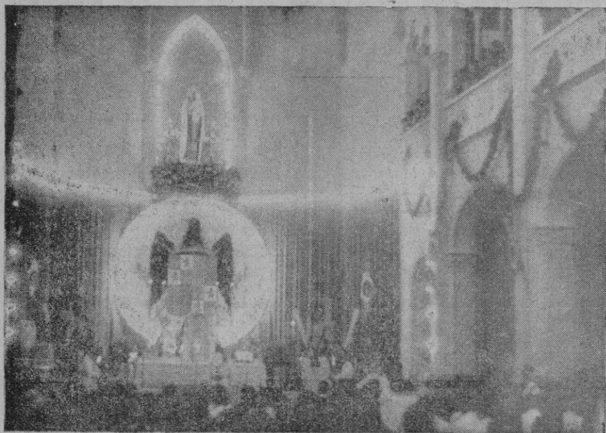
La Marinería a su Patrona la Virgen del Carmen. — Aspecto que ofrecía el altar Mayor de la iglesia de los PP. Carmelitas en Santa Catalina, durante la misa