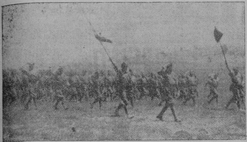
Y pasó la Legión, cantando sus himnos de gloria y de muerte, como desfilaron también los Cazadores y la Artillería...

Cuando nadie esperaba que en agosto de 1936 se practicara manobras militares en África, el mando supremo lo dispuso de una manera precisa y casi imprevista. Pero el ejército de África, a pesar del mal que padecía entonces, porque había compenetración satisfactoria ni armonía posible entre los sucesos inmediatos, se lanzó con alegría a los fatigosos ejercicios de sus armas, y los cumplió con el mismo entusiasmo de sus buenos tiempos. No creía, en verdad, al verle realizar en tal presteza y aptitud los objetivos tácticos del plan desarrollado en brillantemente, que era aquélla la fuerza mediata y esclavizada por los siniestros cabecillas de la revolución extranjera. Fueron esta vez campo, a las montañas de su victoria, como siempre, mejor que siem-