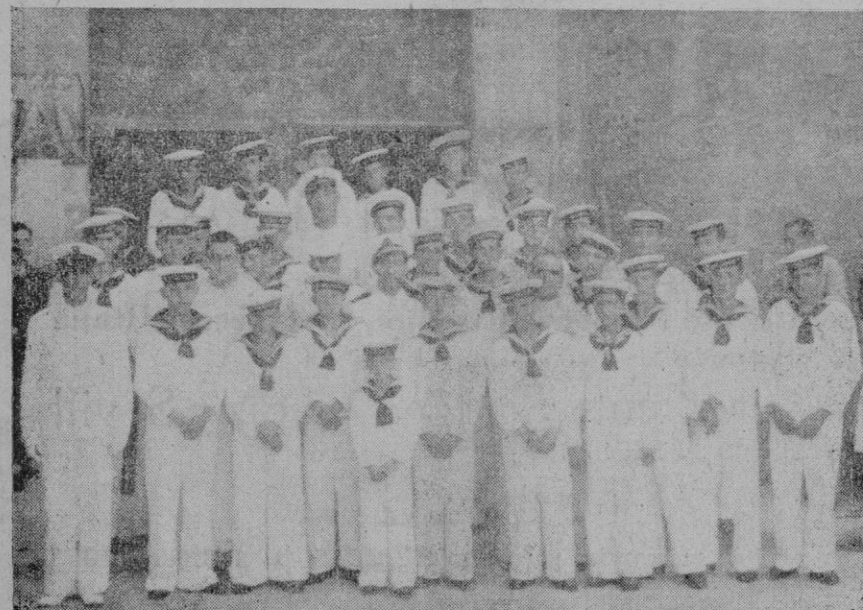
Los Flechas Navales, al salir de la iglesia de la Merced después de celebrada la Misa en honor de la Virgen del Carmen