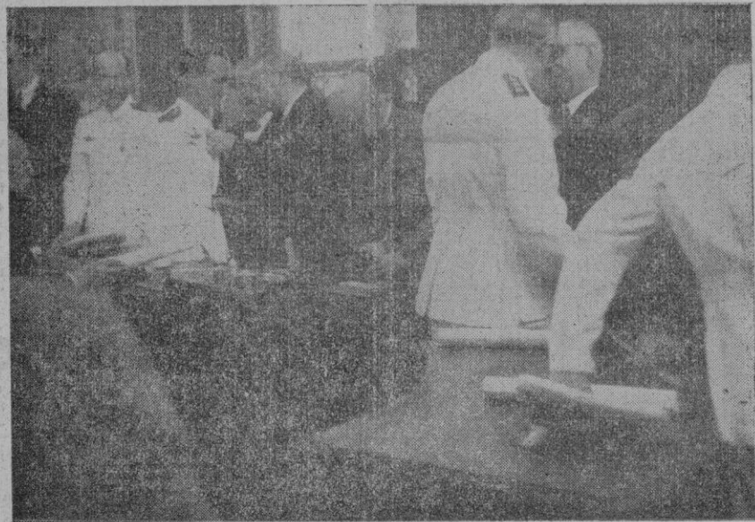
Momento en que nuestras primeras autoridades imponían a los aviadores españoles la medalla de la aviación de Mallorca