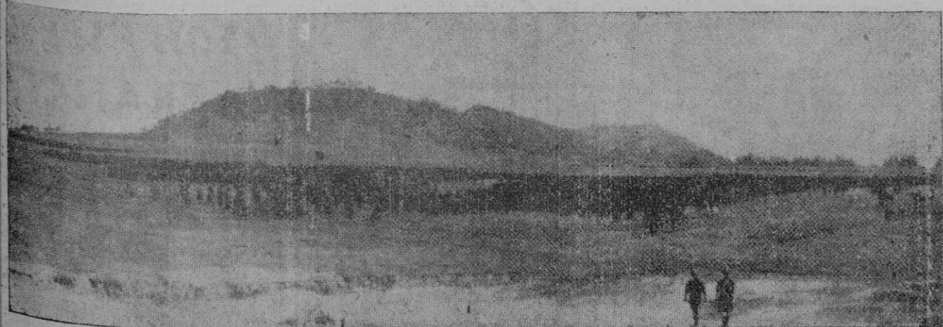
Las fuerzas del Ejército de África se concentraron el 12 de Julio de 1936 en el Llano Amarillo de Ketama