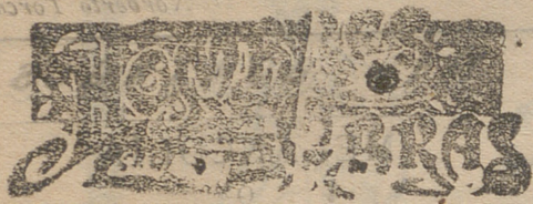
FRAY JUAN DE AVILA

Por sus provechosas predicaciones fué llamado Fray Juan de Avila «el Apostol de Andalucía», y por su elocuencia y méritos de escritor místico, «el venerable maestro». Si la conversión de San Francisco de Borja la resolución benéfica de San Juan de Dios y la vocación de Santa Teresa de Jesús, son pruebas de la razón del primer sobre nombre, las obras que llevan por título «Epistolario; Audi, filia, et vive; Anotaciones al concilio de Trento; Del conocimiento de sí mismo, y De la ocasión», en la que no tuvo, por su persuasiva elocuencia y por la profundidad de su oratoria, quien le aventajara en su tiempo.