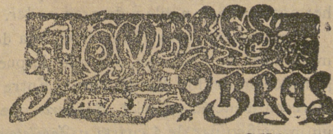
MARGARITA DE ANGULEMA