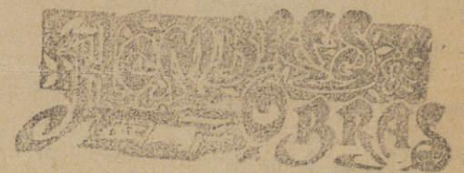
EL DOCTOR ENCINAS

La cantidad diaria variará según la talla del caballo y según la clase y cantidad de los demás alimentos que componen la ración diaria, heno, paja, tojo, etc., de 2 á 5 litros, que, una vez cocidos, aumentan su volumen hasta triplicarle casi. Por cada litro de centeno se pondrán de dos y medio á tres litros de agua. Si el dueño del caballo dispusiera de grandes cantidades de patatas destinadas á la alimentación de los animales, puede asociarlas al centeno cociendo el todo al mismo tiempo, mezcla que aceptan con mucho gusto no solo los caballos, sino también la mayor parte de los animales domésticos, vacas, cerdos, incluso las aves de corral y los conejos caseros.