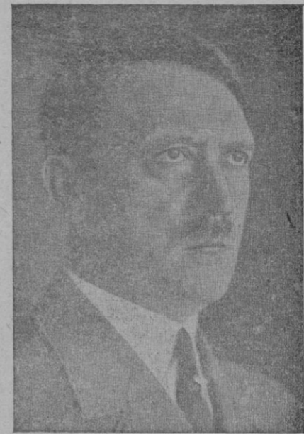
El forjador del Gran Reich, Adolfo Hitler, a quien festeja Alemania con ocasión de cumplir hoy 50 años

Para Alemania, la nación amiga de nuestra España; la que, desde la hora primera, supo apreciar en su justa medida la magnitud de la cruzada liberadora culminada ya en la paz victoriosa; para la Alemania que supo hacer su Revolución para ser de nuevo el Imperio que había sido; para el gran pueblo, inteligente y disciplinado, que ocupa otra vez el sitio que en el concierto de las naciones le corresponde; para el III Reich, es hoy día de júbilo.