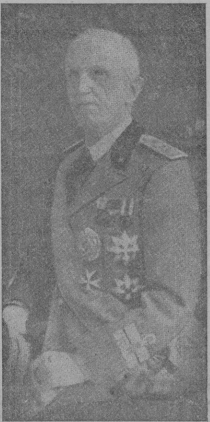
Victor Manuel III, Rey de Italia y Emperador de Etiopía, que acaba de aceptar la corona de Albania, que le había sido ofrecida por aquel pueblo

Es una página nueva e interesante la que se abre en la historia de la humanidad y de los regímenes de los pueblos. El Imperio italiano, sucesor del de los Césares, preséntase ante la vieja Europa con una contribución de energías juveniles que hará ciertamente sentir su influencia en el