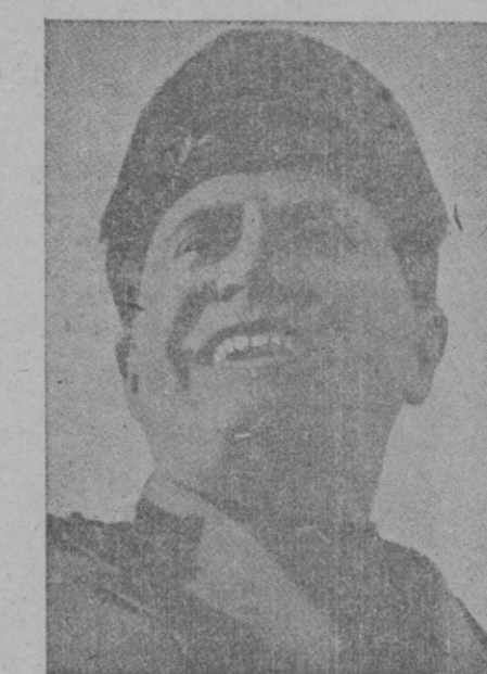
que será el gran certamen, ha hablado Mussolini.

Roma. — Esta mañana, a las once, se ha celebrado en la sala de Julio César, del palacio del Capitolio, la anunciada reunión para tratar sobre la exposición universal de Roma de 1942, reunión que presidió el Duce.