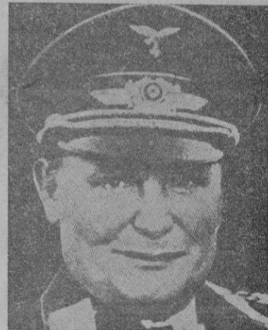
El mariscal Goering

Por la tarde, celebrará una nueva conversación con el Duce.