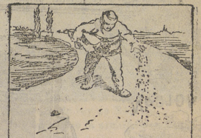
La solución en el próximo número.

A voluntad de sus dueños se vende la casa núm. 11 de la calle de Ibarreta, en esta ciudad.