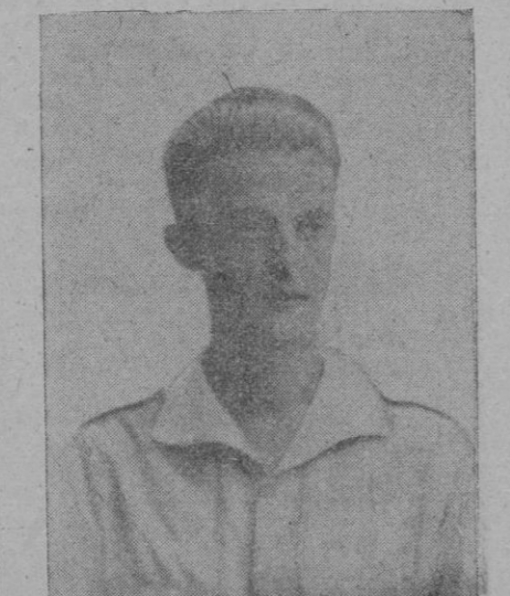
Teatro Nacional de Falange