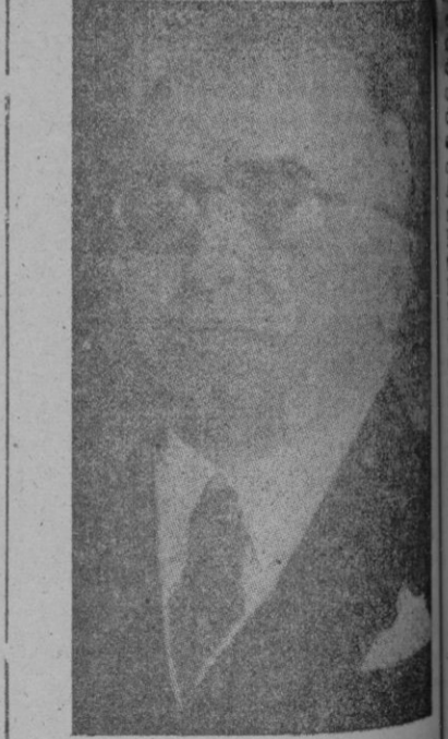
El Dr. Emilio Hacha, último Presidente de la República checoslovaca

La segunda sala está transformada en un verdadero salón de reuniones y hay en él una gran mesa, có-