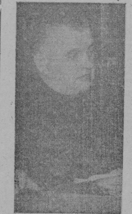
Monseñor José Tisso, Presidente del Consejo eslovaco

Al iniciarse el glorioso Movimiento Nacional, se encontraba destinado, como teniente coronel, en el Regimiento de Pavía, de guarnición en la plaza de Algeciras, y, al recibirse la orden de declaración del estado de guerra, le fué que dar personalmente para la ocupación militar de la plaza y tomar posesión rápidamente, de tal manera, que hubiera abortado los manejos de los rojos, que primum día anticiparse, eligiéndose él de hecho en Director del Movimiento de todo el campo de Gibraltar, en cuyo