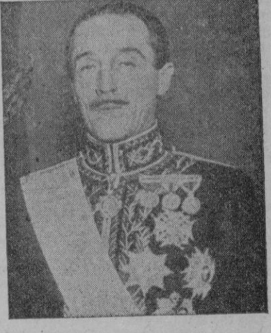
El Duque de Alba

Preguntado luego sobre si se daría acceso al Foreign Office a Azcarate, como antes había sido otorgado al Duque de Alba, contestó rotundamente Mr. Chamberlain: —No, señor; pues la postura de la España nacionalista era muy distinta a la de la zona roja actual. Seguidamente se pasó a discutir otros asuntos, entre ellos temas sobre refugiados españoles y condiciones en que se podrían hacer empréstitos a España. El "placet" inglés al Duque de Alba