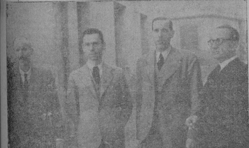
Miembros de la comisión menorquina que se encuentra en Palma

Sorteo de 7 marzo 1939. Núm. premiado 138 con 40 ptas. Aproximaciones 137-139 con 3 ptas. ¡¡Arriba España!!