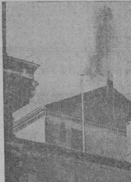
La tradicional "fumata" que anuncia al pueblo romano el resultado de la elección pontificia

Perpiñán. — La prensa de Madrid sigue mostrando la desorientación y nerviosismo que reinan en la capital roja. "Informaciones" dice que "el rumor es el peor enemigo de la República y que hay que perseguirlo implacablemente". Agrega que no se debe contar con la inmediata aplicación de medidas militares, pues el organizador técnicamente una ofensiva no es cosa de un día. La "C. N. T." dice que "en estas horas decisivas cuantos tienen un cargo deben demostrar que lo ejercen dignamente".