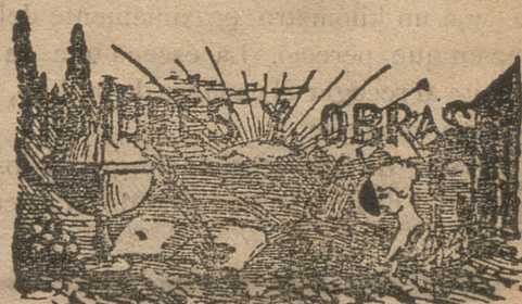
MENENDEZ DE AVILÉS

Se puede emplear también otro medio para levantar el escudete, y es conveniente emplearlo cuando los ingertos son pequeños: consiste en desprender con un hilo de seda ó una cerda el escudete, del que se tiene levantada la parte superior. Las épocas de ejecutar este ingerto son: a) empuje, cuando se pone la savia en movimiento; á ojo ve-lando por San Juan, y á ojo durmiendo al efectuarse el movimiento de la segunda savia por Agosto y Septiembre.