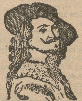
CARLOS I DE INGLATERRA

A Carlos I no sirvieron de enseñanza los sucesos ocurridos en los últimos tiempos del reinado de su padre, y como este, vivió entregado á su favorito Jorge de Williers, duque de Buckingham, y gobernando con violencias y atropellos, por haber heredado del autor de sus días la obstinación de ser soberano absoluto.