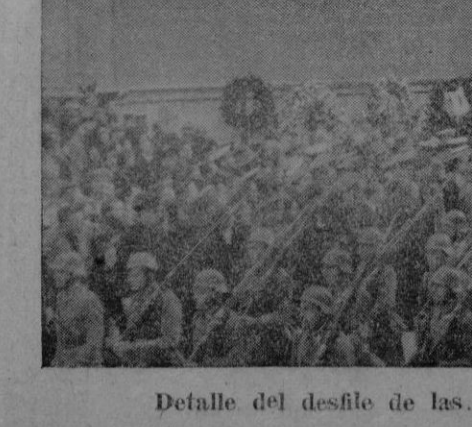
Detalle del desfile de las fuerzas ante las autoridades