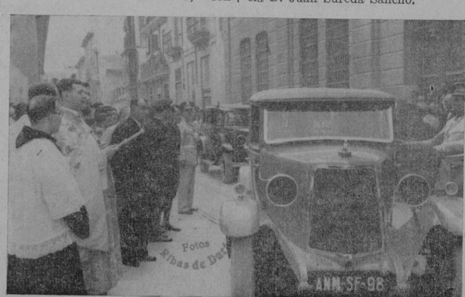
LA FIESTA DE SAN CRISTOBAL

I. Las primeras Autoridades, al salir de la solemne función celebrada en la iglesia de San Francisco. — II. La bendición de los automóviles llevada a cabo por el Rdo. Sr. Vich.