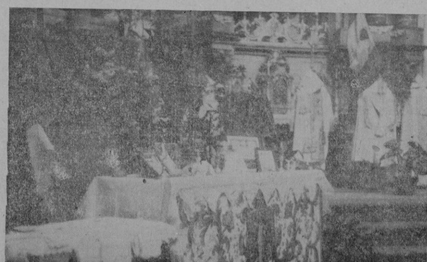
PARA LAS IGLESIAS DE EVANGELIZADAS LEVANTINAS Un aspecto de la magnífica exposición de objetos y ornamentos sagrados instalada en la iglesia de San Antonio de Viana.

Durante los avances de ayer y hoy, los soldados de Franco, han roto el campo enemigo que éste había construido también durante su permanencia en la bella ciudad costera.