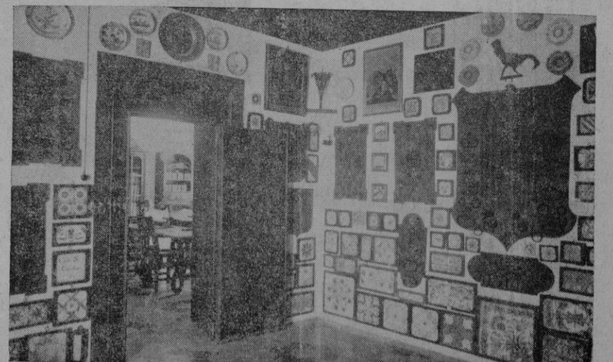
Una de las salas de la Biblioteca de Cultura Artesana, inaugurada ayer en el Palacio Provincial.

Durante todo el día, y principalmente por la tarde y a primera hora de la noche, el desfile de fieles fué continuo y extraordinario.