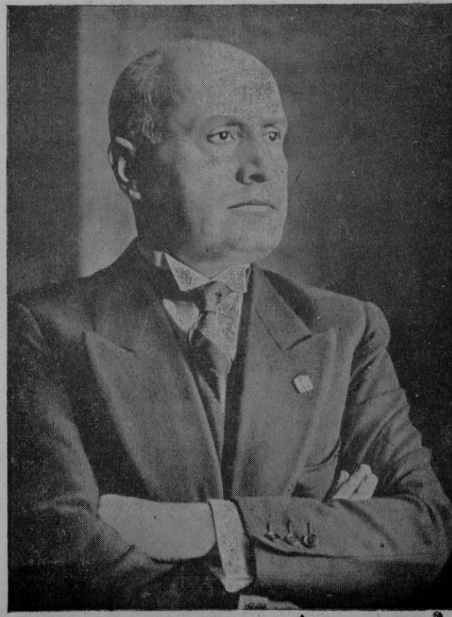
¡VIVA EL DUCE!

Salamanca, 29 de Mayo de 1938 - 2.º Año Triunfal. De orden de S. E. — El General Jefe de Estado Mayor, Francisco Martín Moreno