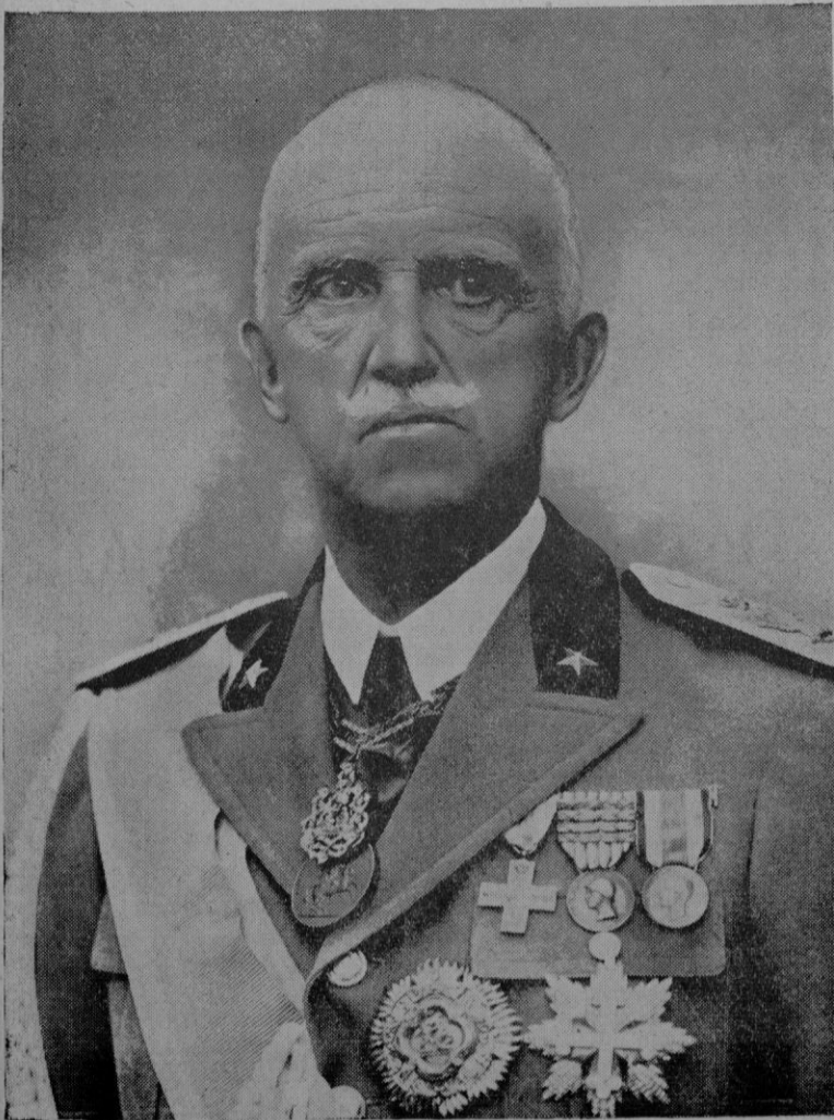
¡VIVA EL REY-EMPERADOR DE ITALIA!

Salamanca, 28 de Mayo de 1938 - 2.º Año Triunfal. De orden de S. E. — El General Jefe de Estado Mayor, Francisco Martín Moreno