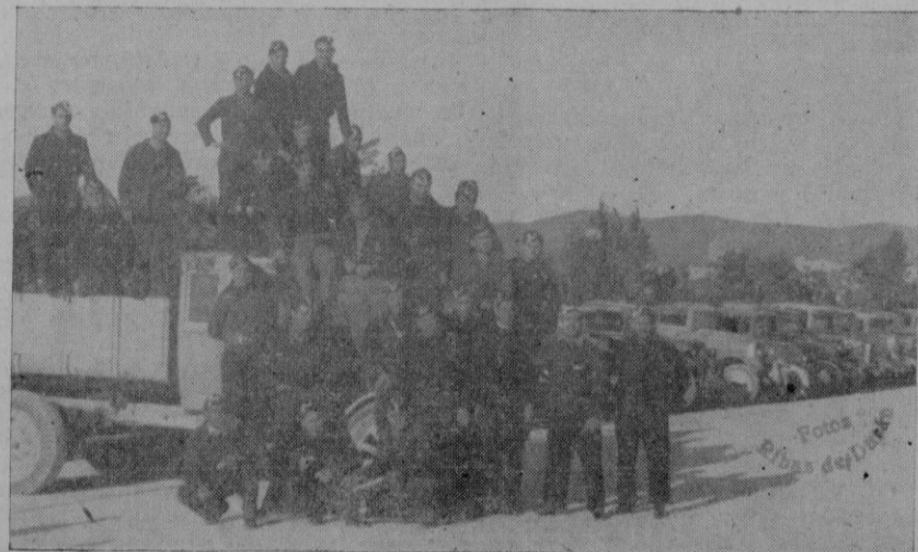
Grupo de los soldados conductores de los camiones militares encargados anteayer de la recogida de la chatarra.

Mediada la mañana de hoy, la jornada ha tenido un escenario, en el aire, donde las alas españolas se han cubierto nuevamente de gloria. Un gran número de aparatos enemigos vinieron en busca de batallones con la pretensión de elevar la moral de sus hombres y conseguir, si ello fuera posible, una rectificación de sus líneas quebradas, pero muy pronto, al paso de los “ratas”, salieron veinte aparatos nuestros, que trabaron con ellos combate en el azul. El resultado de la polémica no pudo ser más rotundo; siete magníficos Martin Bombers y un rata cayeron destrozados para no levantarse más, en detrimento de nuestra España, y tres aparatos más huyeron tocados. Al propio tiempo, los restantes camaradas de pronto