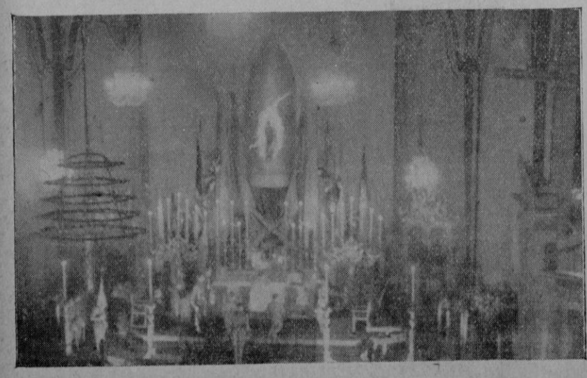
Palma. — En la iglesia parroquial de Santa Cruz, durante la celebración de la fiesta de la Artillería en honor de Santa Bárbara