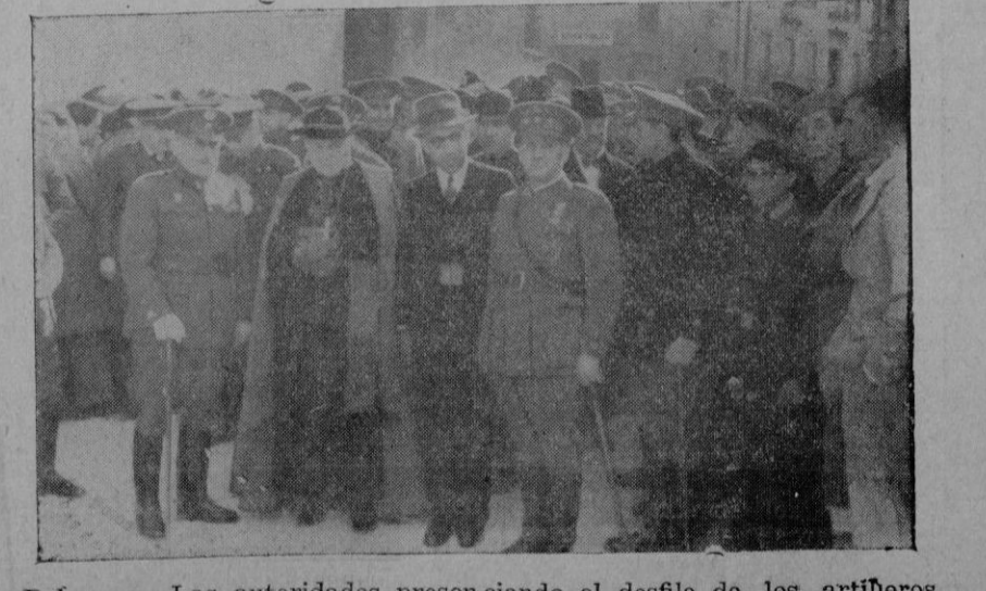
Palma. — Las autoridades presenciando el desfile de los artilleros después de la función en la iglesia parroquial de Santa Cruz