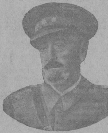
El laureado coronel Moscardó, hoy general, el héroe del Alcázar