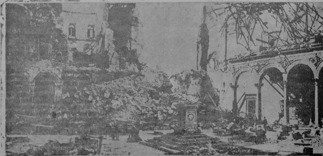
Un aspecto del destruido patio del Alcázar, después de su liberación, lleno de destrozos y de escombros, sagradas reliquias que hablan de una ejemplar epopeya