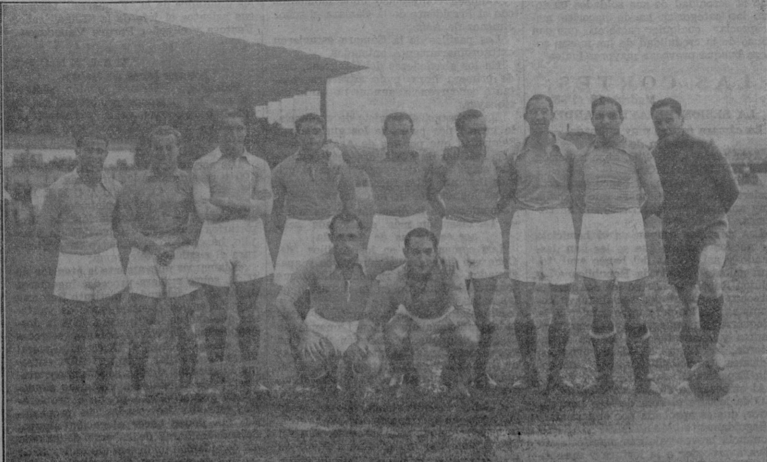
El notable equipo "Oviedo, F. C." que mañana jugará, en Buenos Aires, un partido con el "C. D. Mallorca".

Durante todo este tiempo que falta para la celebración del mismo, tanto los periodistas, como los árbitros, lo aprovecharán para adiestrarse en la lucha libre del "cachs"... ante los posibles derroteros que pueda tomar el partido.