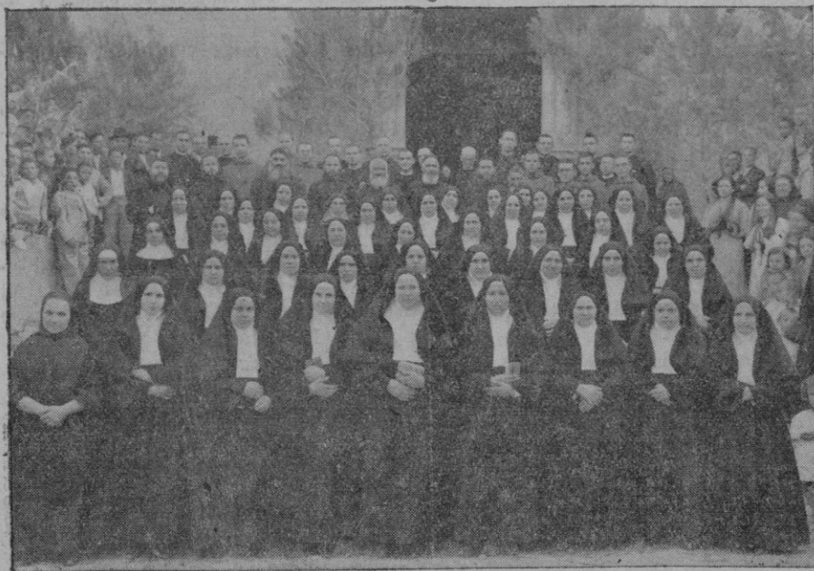
Los sacerdotes, religiosos y religiosas naturales de Villafranca que acudieron a las fiestas