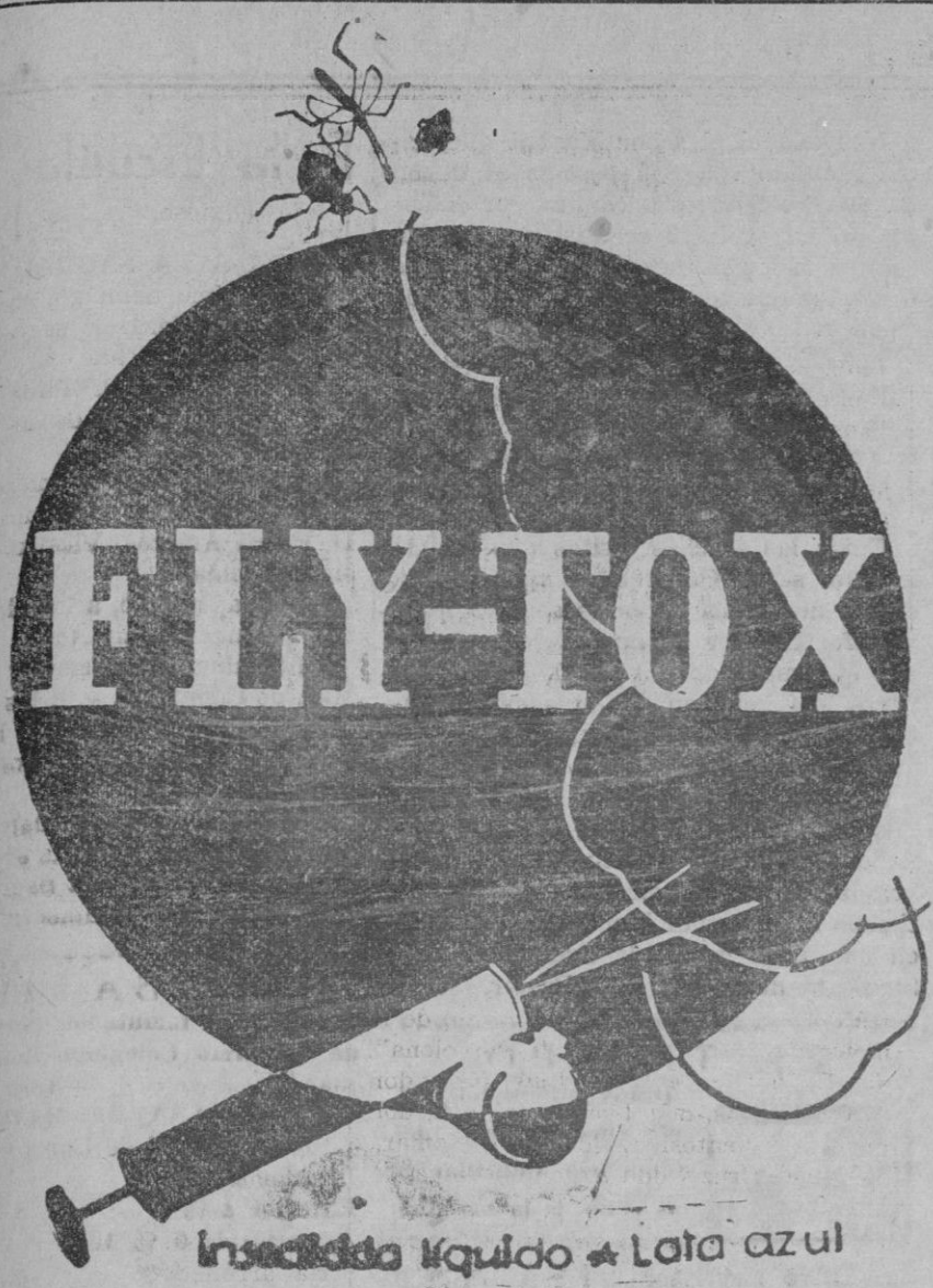
Insecticida líquido - Lata azul